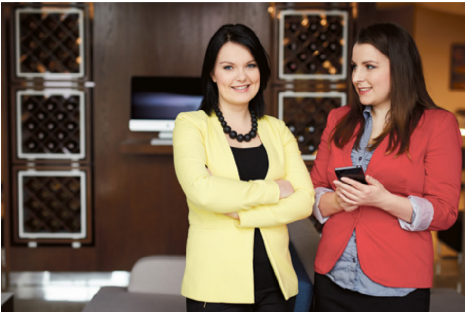
Studentki Wyższej Szkoły Bankowej podczas egzaminu na studiach podyplomowych

Nauka na studiach podyplomowych zwykle jest bardzo przyjemna. Nie czujemy presji, że „trzeba”, wiedza jest skondensowana, roczne czy dwuletnie studia nie zniechęcają swoją długością. To dojrzały wybór, że chcemy się w czymś rozwijać.