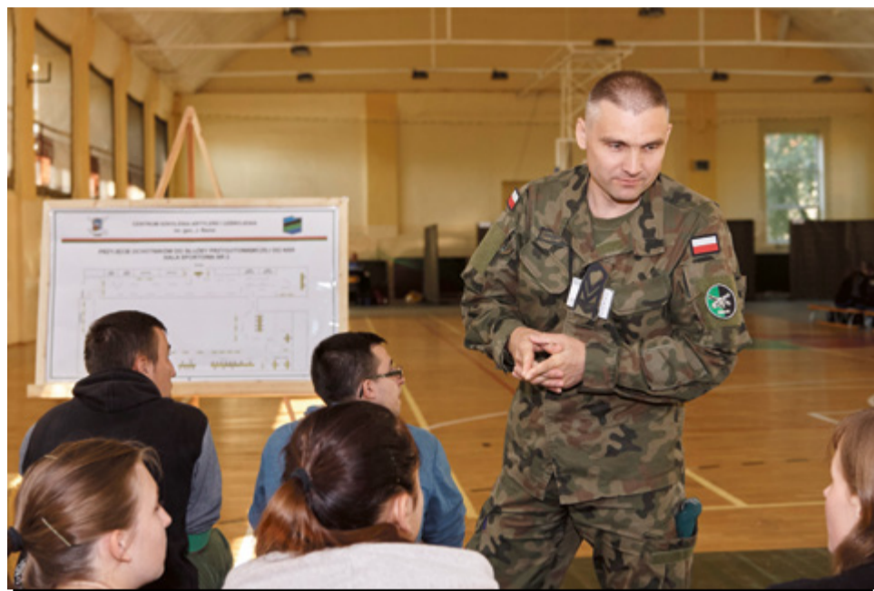
Przygotowawcza służba wojskowa cieszy się dużym powodzeniem

-Mile widziani są chętni, którzy wcześniej odbyli już jakieś kursy, tj. prawo jazdy, gdyż na kierowców w szczególności z kategorią C jest obecnie duże zapotrzebowanie, dotyczy to również ratowników medycznych, czy płetwonurków