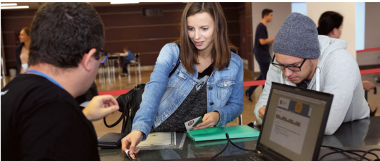
Kandydaci toruńskiej uczelni podczas naboru na studia

WRZESIEŃ JEST JESZCZE SZANSĄ NA DOSTANIE SIĘ NA STUDIA I ZNALEZIENIE DLA SIEBIE ODPOWIEDNIEGO KIERUNKU. NIEKTÓRE Z NICH ZOSTAŁY JUŻ OBSADZANE PODCZAS PIERWSZEGO NABORU. TE, KTÓRE JESZCZE CZEKAJĄ NA STUDENTÓW, NIE SĄ WCALE GORSZE.