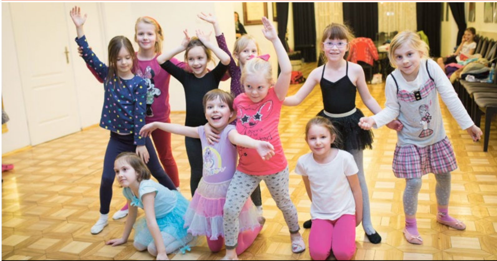
Ferie w Domu Harcerza można spędzić między innymi z zespołem tańca współczesnego „Hulajnoga”