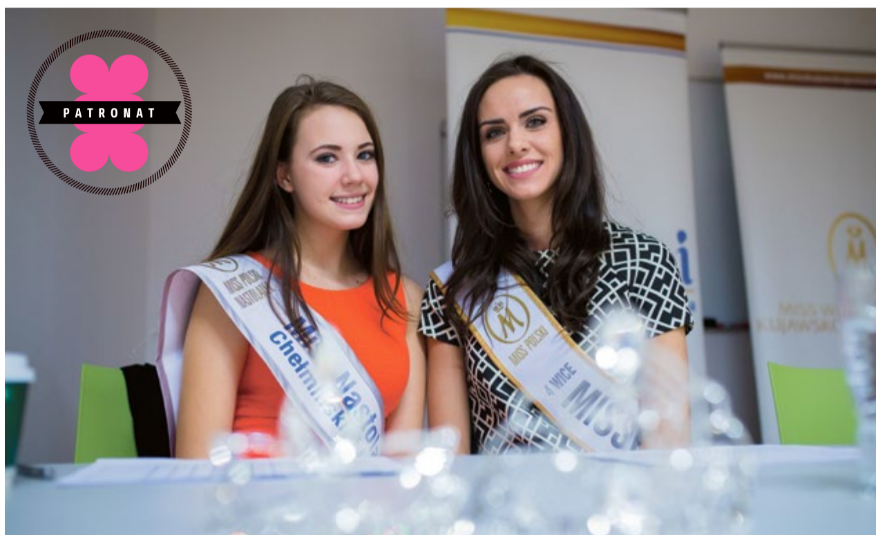
Relacja z toruńskiego castingu na www.toronto-magazyn.pl/fotorelacje

- Przede wszystkim szukamy dziewczyn które mają dużo uśmiechu. Pytaliśmy o zainteresowania i plany na przyszłość. Udział w konkursie jest ogromną przygodą, ale i ciężką pracą. To wyzwanie! Szukamy pięknych i mądrych dziewczyn. Celem naszego wydarzenia jest nie tylko upowszechnianie i promowanie wśród kobiet z województwa kujawsko-pomorskiego piękna i wizerunku kobiety