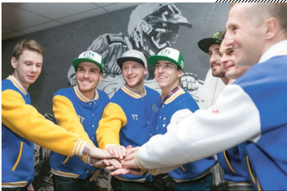
Drużyna żużlowa już gotowa do walki w nadchodzącym sezonie

Ekspert od „czarnego sportu” podkreśla, że największym problemem w minionym sezonie był brak lidera toruńskiej drużyny, szczególnie widoczne było to w decydujących meczach. Teraz ma być zupełnie inaczej. –Skład jest bardzo obiecujący i walka o medale jest bardzo realna. Jednak w sporcie wszystko jest możliwe, tym bardziej w sporcie żużlowym, któremu towarzysza kontuzje. Do sportu trzeba podejść z dystansem. Kiedy patrzę na moje doświadczenie żużlowe,