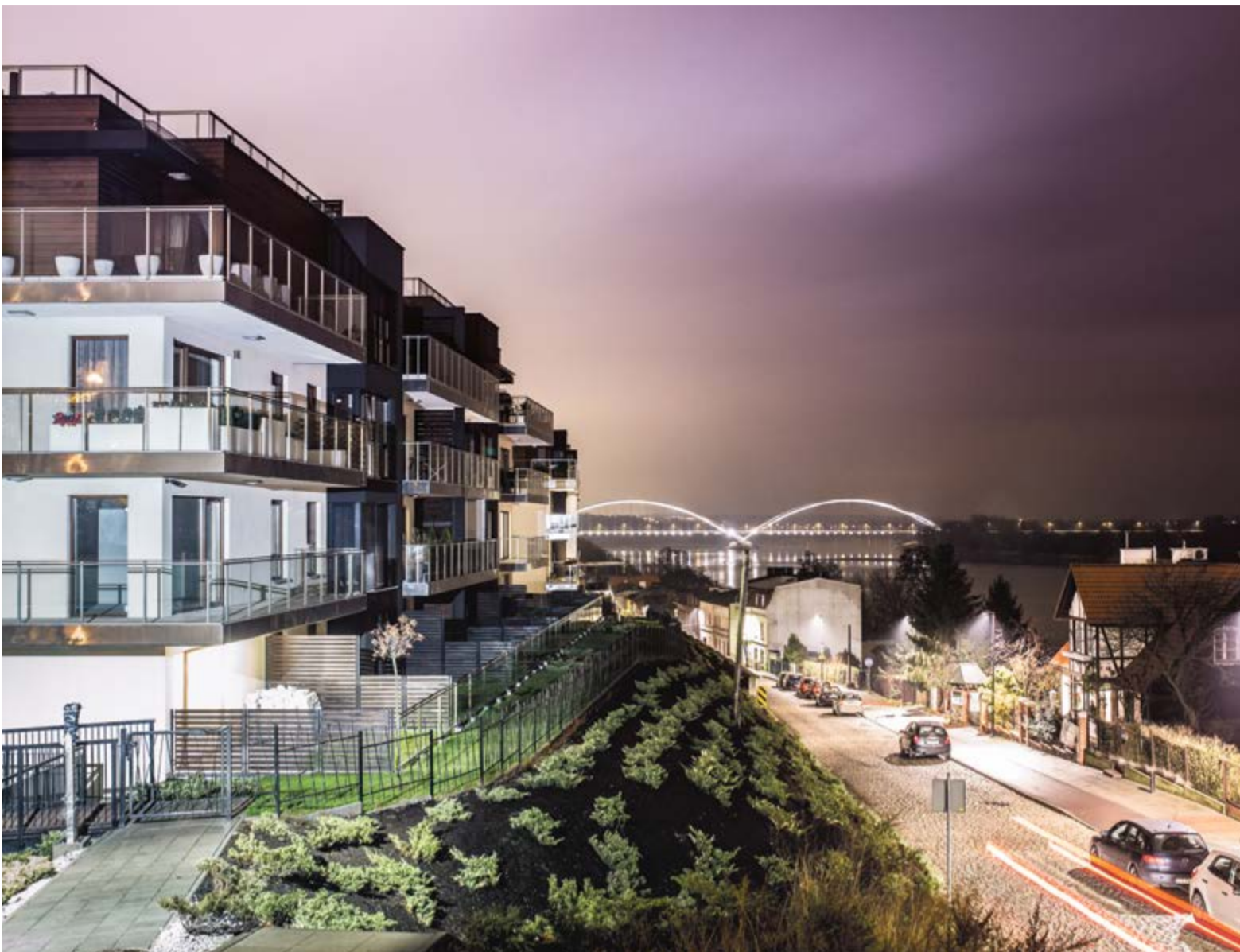
Osiedle Winnica