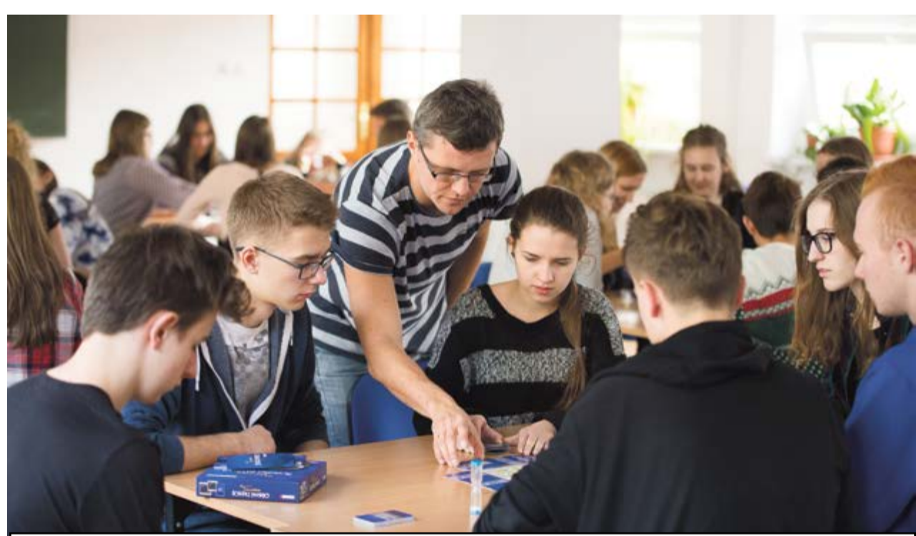
Gra to połączenie nauki i zabawy,

Gra była prezentowana już w Zespole Szkół nr 9 na Wrzo-