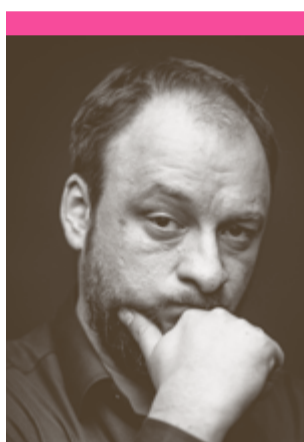
Je suis Russe

Felieton w tym tygodniu musi dotyczyć tragedii w Paryżu. Ale też faktu, że dopiero to uderzenie w świat nam znany i bliski, wstrząsnęło nami. Bo ginący setkami Irakijczycy, Kurdowie, Nigeryjczycy czy nawet Rosjanie mignęli nam zaledwie, jak przebitki w kolejnym newsie w TV. Nie będę opisywał wydarzeń z 13 listopada w Paryżu. Każdy, kto choć trochę interesuje się światem wie, co się stało. Po