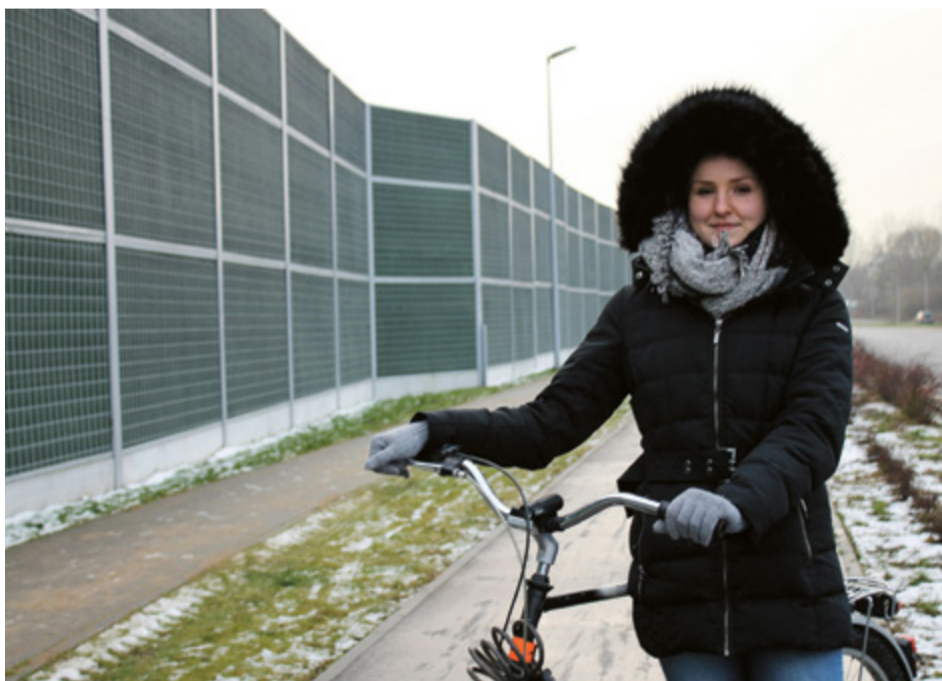
W Toruniu z roku na rok poprawiają się warunki jazdy dla rowerzystów

Spotkanie otwarte, zaplanowane na przyszły rok, będzie drugim etapem tworzenia koncepcji – zaprezentowana zostanie wówczas robocza wersja dokumentu, dostępna również dla zainteresowanych w internecie. Będzie to kolejna okazja, żeby mieszkańcy wnieśli swoje opinie i propozycje. – Kiedy zakładaliśmy nasze stowarzyszenie w 2006 roku, tras rowerowych było niewiele. Priorytetem jest to, żeby infrastruktura rowerowa tworzyła w mieście spójną całość. W Toruniu z roku na rok sytuacja się poprawia, co oczywiście cieszy. Pozostają jednak miejsca, które wymagają kontynuacji udogodnień dla niezmotoryzowanych. To na przykład odcinek