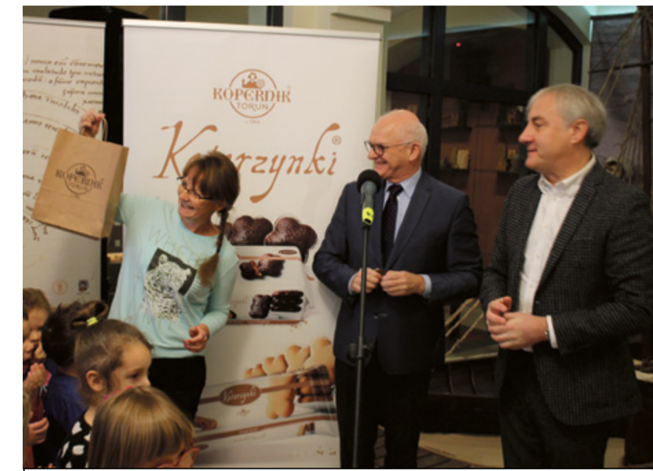
Toruńskie pierniki to marka, która od lat przyciąga do Grodu Kopernika

– Mam zaszczyt pracować w fabryce, gdzie podtrzymywanie tradycji od zawsze jest niezwykle istotne. Produkt tradycyjny jest jak kanon. Wszystko dookoła