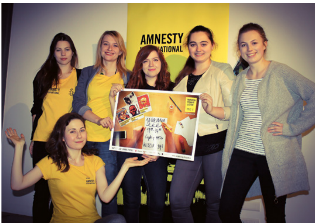
Maraton Pisania Listów organizowany jest przez Amnesty International

Listy pisane w ramach Maratonu skierowane są zarówno do władz państwowych, jak i