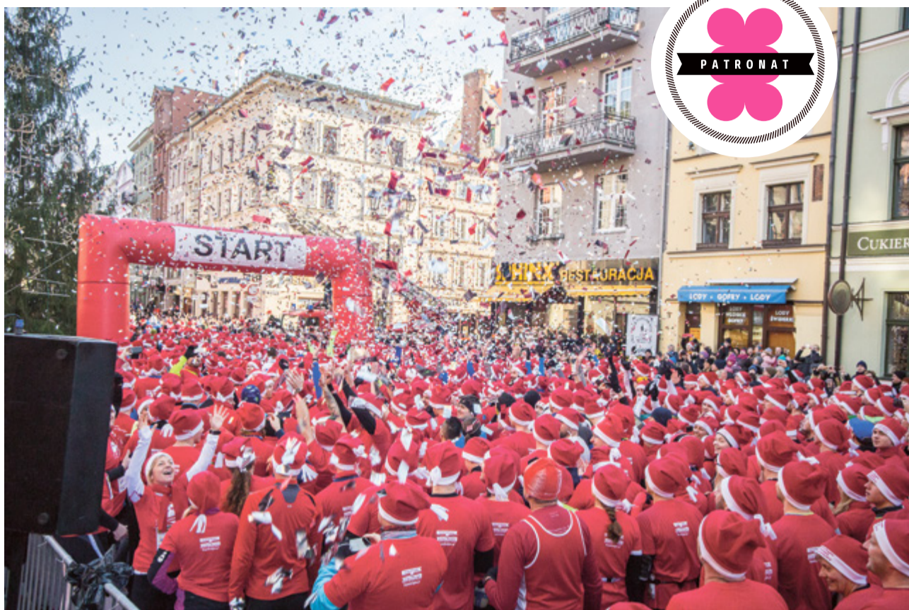
Już w najbliższą niedzielę Toruń odwiedzą biegający Mikołaje z całego kraju

Wiek uczestników? W półmaratonie i na 10 kilometrów mogą wystartować osoby powyżej 15. roku życia do... „nieskończoności”. Spełnieniem marzeń uczestników będzie oczywiście zmieszczenie się w czasie, być może miejsce na podium, ale przede wszystkim szczęśliwe dotarcie do mety, czyli stadionu miejskiego przy Bema. Czekający na finiszu na