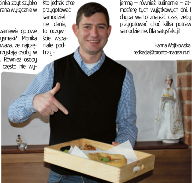
W Osetia specjalizuje się w pierogach

Hanna Wojtkowska redkacia@toronto-magazyn.pl