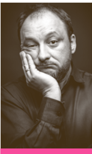
Kultura wygra z betonem

Są takie chwile, gdy wraca do mnie pytanie, co jest ważniejsze: kultura czy infrastruktura. Duch czy beton. Spektakl teatralny czy trasa średnicowa. Wszystko i wszyscy mówią, że trasa i beton. Czasami przestaje mi się chcieć wal-