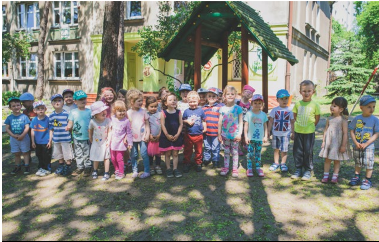
Dzieci z przedszkola „Leśny Ludek” w Toruniu

Dzieci, młodzież, a i pewnie dorośli wybiorą się w podróż do świata bohaterów Star Wars. Będzie można korzystać ze strefy konsoli, zrobić sobie pamiątkowe zdjęcia w strojach bohaterów Star Wars oraz pokolorować postacie z filmu. W południe rozpocznie się rywalizacja w konkursie wiedzy o Gwiezdnym Wojnach oraz wyścig w grze Disney Infinity, w którym uczestnicy używać będą gigantycznych figurek bajkowych bohaterów. Równolegle rozpocznie się wyścig druidów oraz szkolenie koman-dosów. Dwudniowa impreza co-dziennie od 10.00 do 18.00.