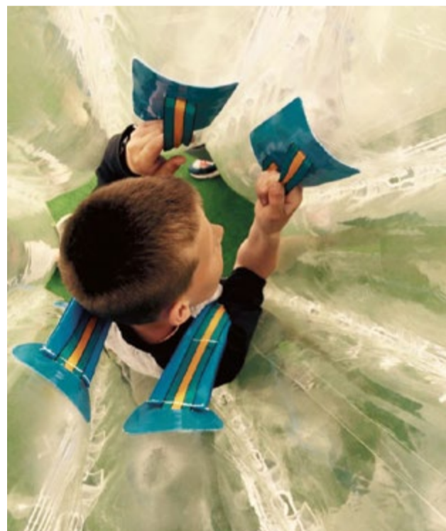
Młtn Wiedzy zaprasza dzieci na wielki rodzinny piknik

Przed meczem z ROW-em Rybnik od 13.00 w miasteczku małego kibica na dzieci będą czekały atrakcje związane z jazdą na pitbikach, a także kuglarze z grupy cyrkowej, dmuchańce, wata cukrowa. Całość poprowadzą dziennikarze z Radia Gra.