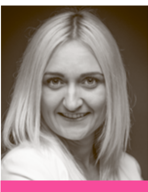
Feta na Starówce

Fryzjer, piekarz i restaurator. Niezależnie od branży, w której pracują, staną obok siebie. Tego dnia nie będzie liczył się utarg i ilość gości, która się przewinie. Pucybut zadba o obuwie gości, restauracja zdradzą tajemnicę dobrej kuchni, nie zabraknie atrakcji dla dzieci. Szewska i Szczytna już w najbliższą sobotę będą świętować. Przedsiębiorcy wyjdą ze swoich lokali, żeby nie tylko pokazać to, czym się zajmują, ale także