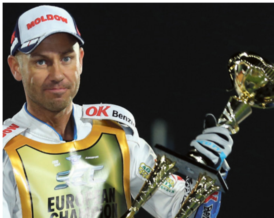
Czy Nicki Pedersen wygra ponownie?

Już po raz piąty cykl Speedway Euro Championship wyłoni najlepszego żuźlowca na Starym Kontynencie. Obrońcą mistrzowskiego tytułu będzie Nicki Pedersen, który swoje pierwsze złoto europejskiego czempionatu zdobył w niebywałych okolicznościach. Ogłoszono nazwiska zawodników, którzy otrzymali stałe dzikie karty na tegoroczny cykl.