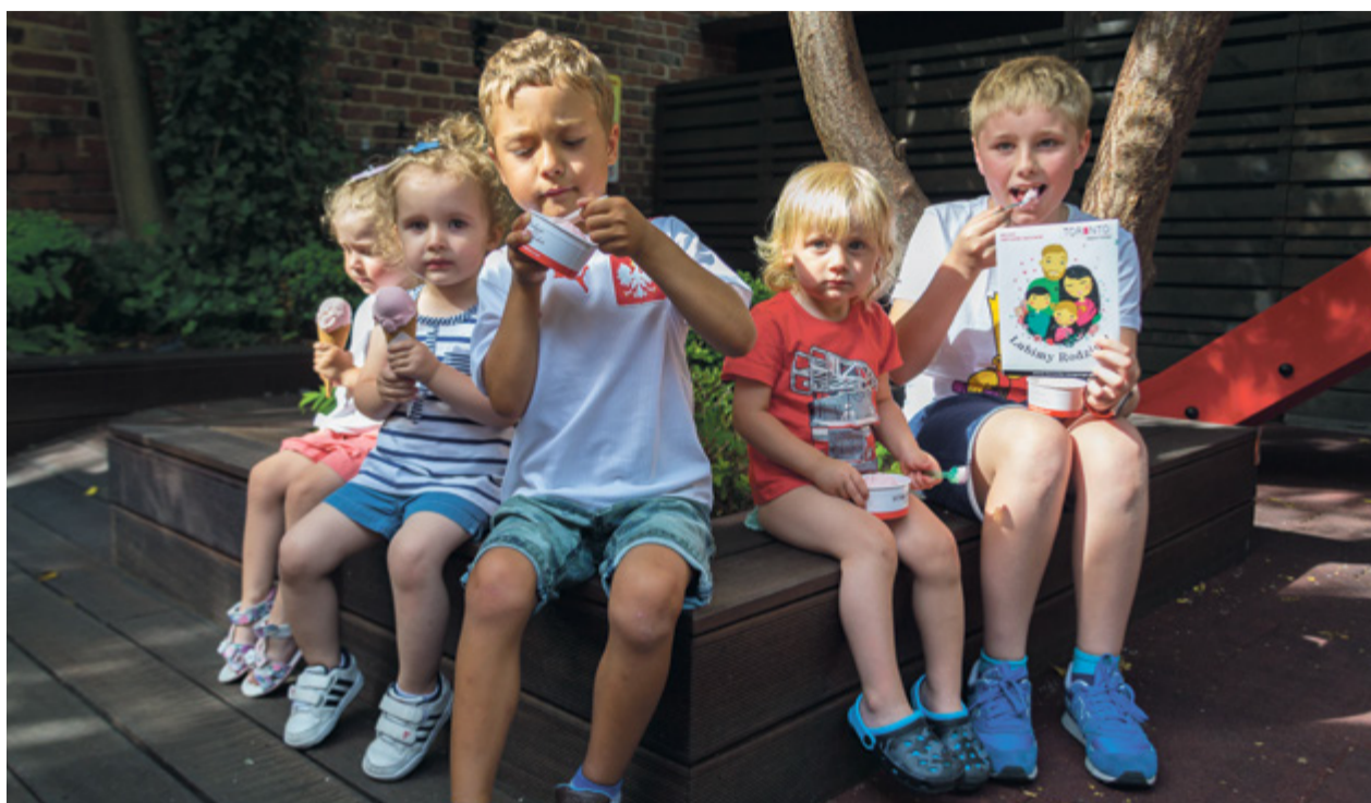
Wiele toruńskich restauracji i kawiarni jest przyjaznych rodzinom

Ale największy problem, szczególnie w marketach dużych sieci, to ilość towaru. Promocje czyhają na każdym kroku, „wyspy” z towarami między półkami lub przecinające ciągi komunikacyjne, z wózkiem już nie przejadę. Czasem się zastanawiam, jak radzą sobie rodzice z podwójnym wózkiem, dla dzieci „rok po roku”. Niektóre