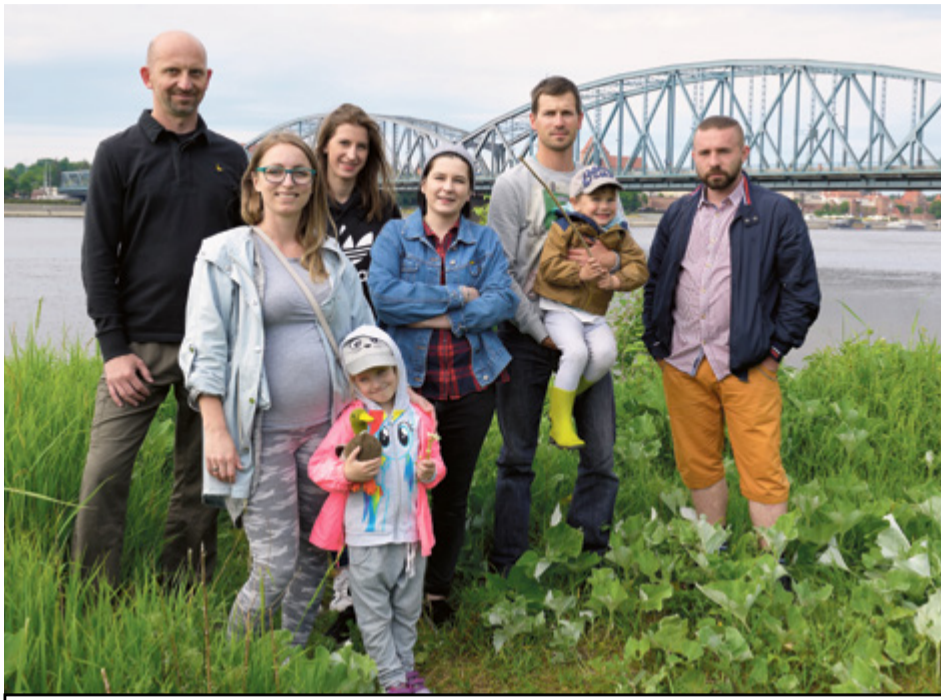
Kujawsko-Dobrzyńska Organizacja Turystyczna chce przywrócić plażę

Po raz kolejny mieszkańcy mają decydujący udział w wydawaniu miejskich pieniędzy. Na co rozdysponują kwotę 7 mln zł? Jakie nowe inwestycje wzbogacą przestrzeń naszego miasta? Głosowanie na projekty zgłoszone w ramach budżetu partycypacyjnego rusza 17 czerwca.