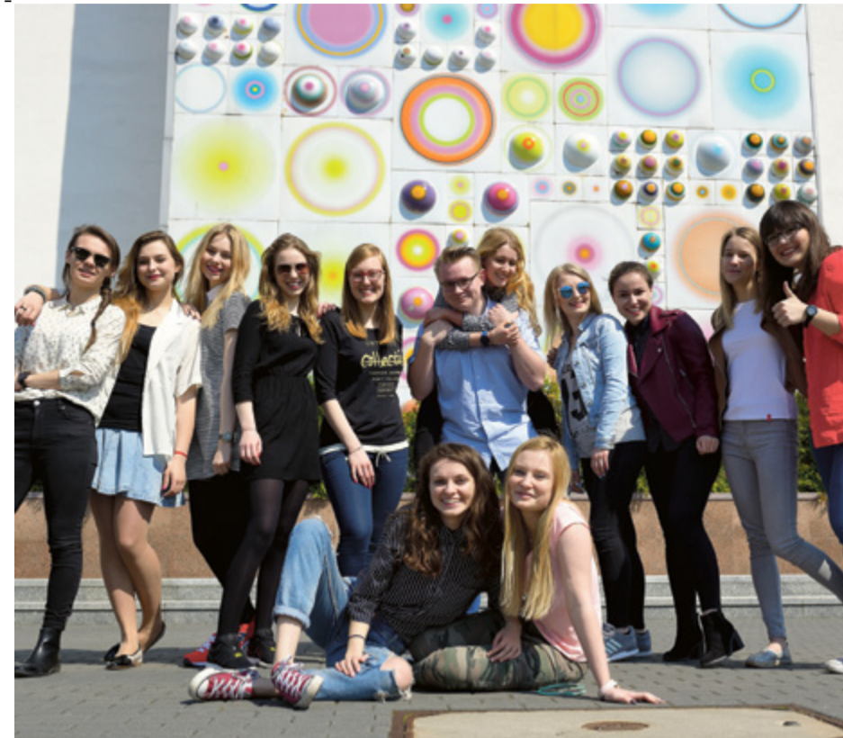
Jakie tradycje juwenaliowe jeszcze znacie? Zapraszamy na www.toronto-magazyn.pl

„Pochód Juwenaliowy”, „Śniadanie na trawie” czy „Mecz w Błocie” to klasyka juwenaliowego repertuaru. Zgodnie z dewizą, że nie samymi koncertami student żyje, Samorząd Studencki UMK zadbał o organizację szeregu atrakcji plenerowych. Oprócz tradycyjnych wydarzeń warto zwrócić uwagę na kilka nowości.