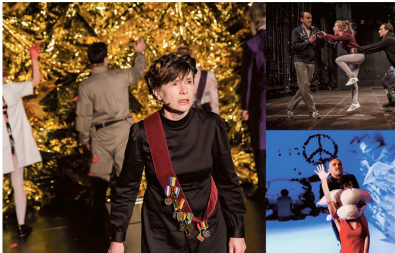
W ramach festiwalu będzie można obejrzeć dwanaście spektakli

Dotykają problemów współczesnej rzeczywistości – tożsamości człowieka, inności, traum powojennych, tolerancji, miłości... Amatorów teatru czeka dwanaście ciekawych spektakli. Od 20 do 26 maja w Teatrze im. Wilama Horzycy jedyny taki w Polsce, organizowany po raz czwarty, Festiwal Debiutantów „Pierwszy Kontakt”.