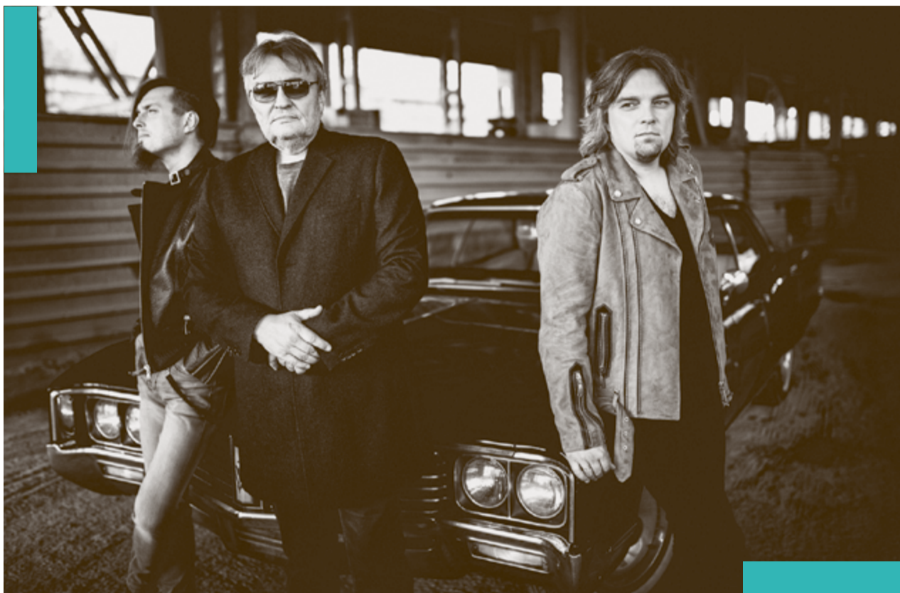
Cugowscy to jeden z zespołów, który wystąpi na scenie Juwenaliów