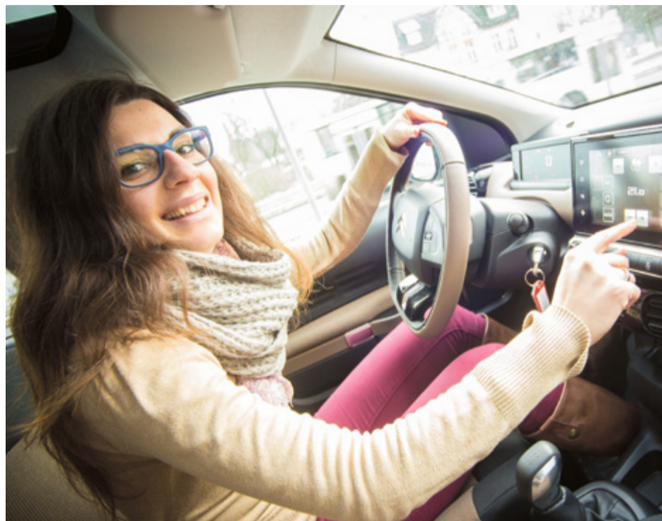
Zanim kandydat na kierowcę wsiedzie sam za kierownicę musisz przejść kurs nauki jazdy i zdać egzamin

jest taka sama, jak w ruchu drogowym. Na placu największej trudności sprawia cofanie wyznaczonym pasem ruchu.