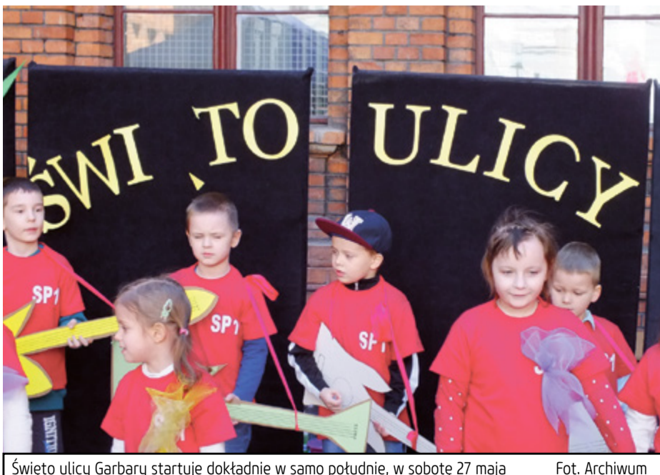
Święto ulicy Garbary startuje dokładnie w samo południe, w sobotę 27 maja

przyjazne rodzinom, nie może więc zabraknąć przedstawienia w wykonaniu aktorów Baja Pomorskiego. Zaplanowano również warsztaty samoobrony, turniej piłkarski, wystawę foto-