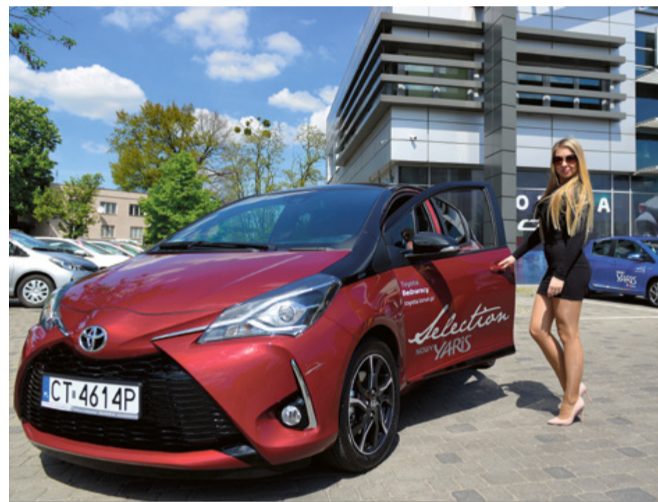
Wiosna to czas gorących motoryzacyjnych premier

Miłośnicy konkretnych marek samochodów oczekują na kolejne premiery nowych modeli. Poprzednie wersje po liftingach lub całkowicie nowy design – które auta staną się tegorocznymi hitami? Na podsumowania przyjdzie czas w nowym roku. Póki co prezentujemy nowości.