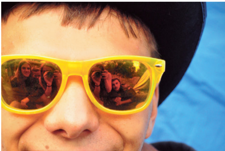
Według tradycji Juwenalia to podobno ostatnia impreza przed sesją