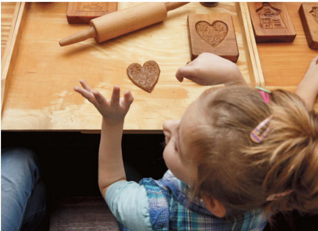
Z piernika można zrobić różne cuda, również bożonarodzeniową szopkę

Twórcy zamienili swoje dotychczasowe tworzywo – glinę, na nową, nieoczywistą materię twórczą – ciasto piernikowe. Posłużyło ono zarówno do stworzenia najważniejszych bohaterów – świętej rodziny, jak też samej konstrukcji szopki, w której ostre łuki oraz mistrzynie ułożone piernikowe „cegietki” nawiązują do gotyckich budowli Torunia. Efekt rzeźbiarskich zmagania artystów – niezwykłą, urzekającą subtelnym urokiem, piernikową szopkę będzie można oglądać w Muzeum Toruńskiego Piernika do 2 lutego 2017.