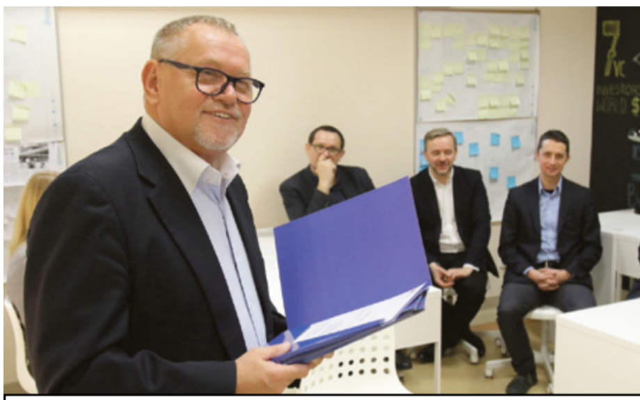
Zwycięstwo w konkursie „Pomysł na własną firmę” to szansa na rozwój własnego biznesu.

Hanna Wojtkowska redakcja@toronto-magazyn.pl