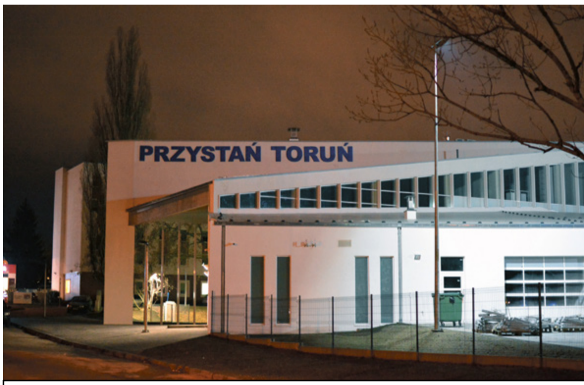
Nowa przystań już służy żeglarzom i wioślarzom

– Czynimy to w 70. roku działalności AZS-u UMK, tuż nad wiślanym brzegiem, przed bliskimi już świętami Bożego Narodzenia i powitaniem nowego roku, który będziemy jednak przeżywać także w Toruniu jako Rok Rzeki Wiśły.