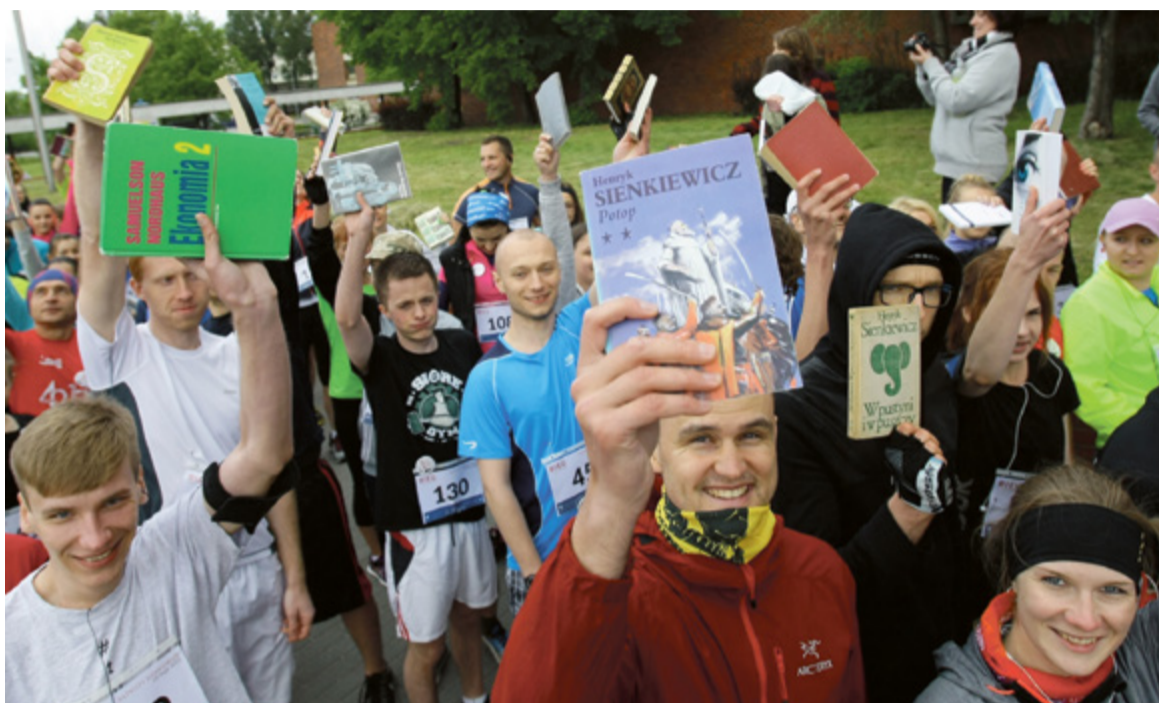
Bieg z Książką przjął się wśród studentów

UMK to również dobry sposób na promocję i rozwój uniwersytetu.