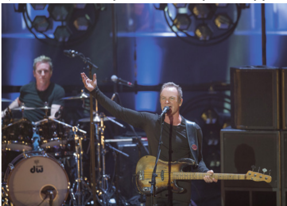
Niepowtarzalny koncert Stinga niestety już za nami

To był wyjątkowy występ nie tylko dlatego, że artysta tej miary pojawił się w naszym mieście. Wydarzenie miało także niecodzienną formułę. Twórca, w ramach promocji nowej płyty, poszukiwał w Europie, w tym w Polsce, kameralnych miejsc, w których mógłby zarejestrować materiał telewizyjny. Sting zrezygnował z honorarium za występ i z tego właśnie powodu impreza nie była biletowana. Taka formuła to praktyka często stosowana przez artystów tej miary przy promocji nowego materiału. Firma Universal, która jest organizatorem trasy promocyjnej Stinga, miała do wyboru kilka lokalizacji jego występu w Polsce. Okazało się, że to właśnie sala na Jordankach spełniła najlepiej oczekiwania producenta. Z uwagi na gabaryty sali oraz charakter występu ilość darmowych wejściówek była znacznie ograniczona. Większość z nich rozdawana była członkom fan klubu Stinga. Część zaproszeń można było też wygrać w konkursach organizowanych w lokalnych mediach. Dzięki nim kilkuset szczęśliwców mogło zobaczyć artystę na żywo.