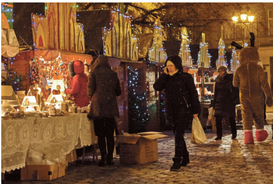
Jarmark Bożonarodzeniowy odbywa się na Rynku Staromiejskim