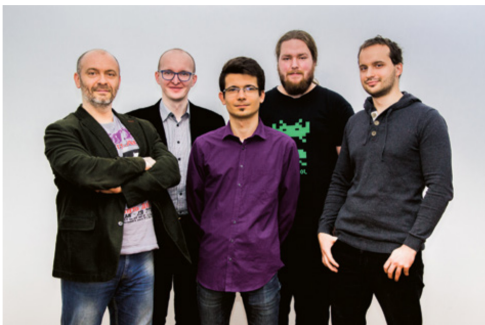
Zespół pracujący w innowacyjnym laboratorium

Jak sami mówią, czysta woda to bezdyskusyjnie nasz skarb. Dlatego tak ważne jest, by monitorować jej czystość. W Toruniu powstało laboratorium, które będzie robiło to w wyjątkowy sposób. Jaki?