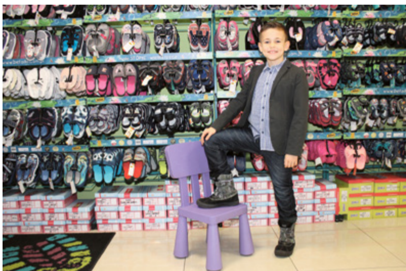
Na zimę dobre są nowoczesne materiały z membraną

prze wszystkim chronić przed zimnem. Dobrze, żeby ocieplenie wewnętrzne posiadało dodatkową warstwę puchu. Wygoda, optymalnie ciepło, nieskrępowa-