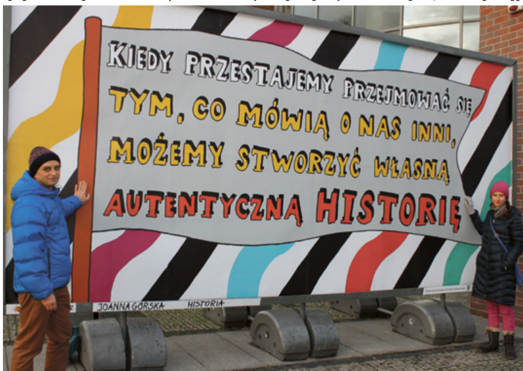
Jeden z nowych billboardów Galerii Rusz znajduje się przy Centrum Sztuki Współczesnej „Znaki Czasu”

że być postacią wyrazistą. W dzisiejszych czasach brakuje takich „Ciechowskich”, ludzi tworzących własny, niepowtarzalny i oryginalny