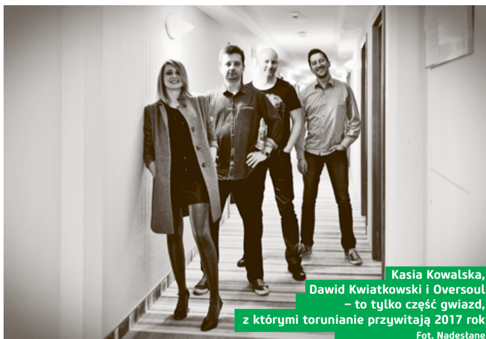
Kasia Kowalska, Dawid Kwiatkowski i Oversoul – to tylko część gwiazd, z którymi torunianie przywitają 2017 rok

Podczas sylwestrowej nocy dostępne będą parkingi: przy placu św. Katarzyny, przy Centrum Sztuki Współczesnej, przy CKK Jordanki oraz w otoczeniu Zespołu Staromiejskiego. Mamy również dobrą wiadomość dla osób, które nie planowały dotrzeć autem na wieczorny koncert. Miejski Zakład Komunikacji postanowił uruchomić dodatkowe połączenia odwożące mieszkańców, dzięki czemu w każdym kierunku Torunia autobusy będą kursować 15 i 45 minut po pełnej godzinie. Co więcej, podczas sylwestrowej