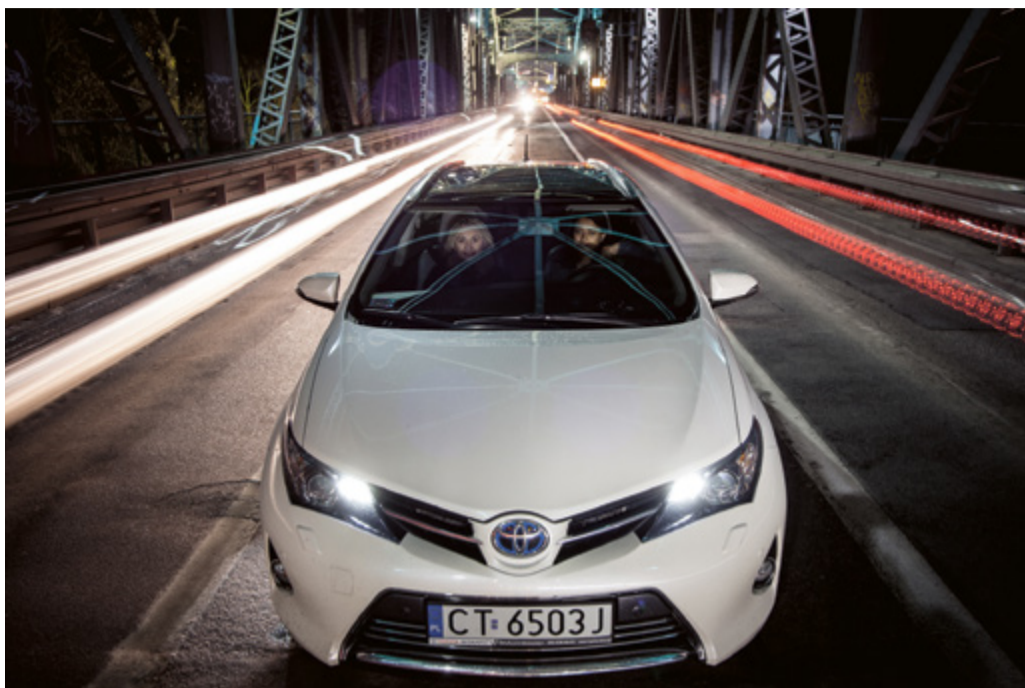
Ciemno, ślisko – taka pogoda sprzyja kolizjom

Zima to czas, kiedy musimy się zmierzyć z utrudnionymi warunkami na drogach. Wypadków i kolizji na co dzień nie brakuje – jakie są ich najczęstsze przyczyny i czy w każdym przypadku należy wezwać policję?