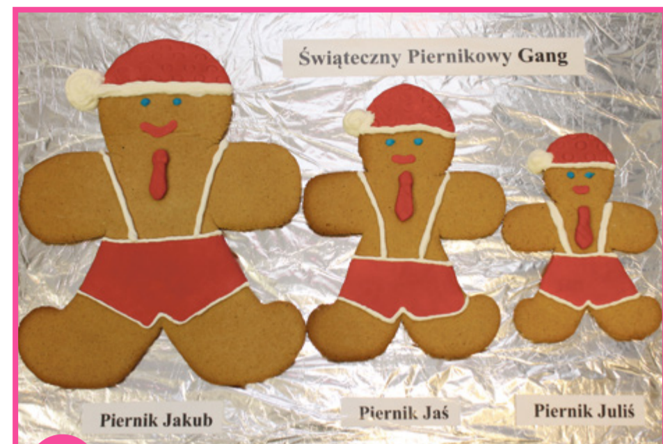
Świąteczny Piernikowy Gang

Poniżej przedstawiamy dziesięć wyróżnionych pierników.