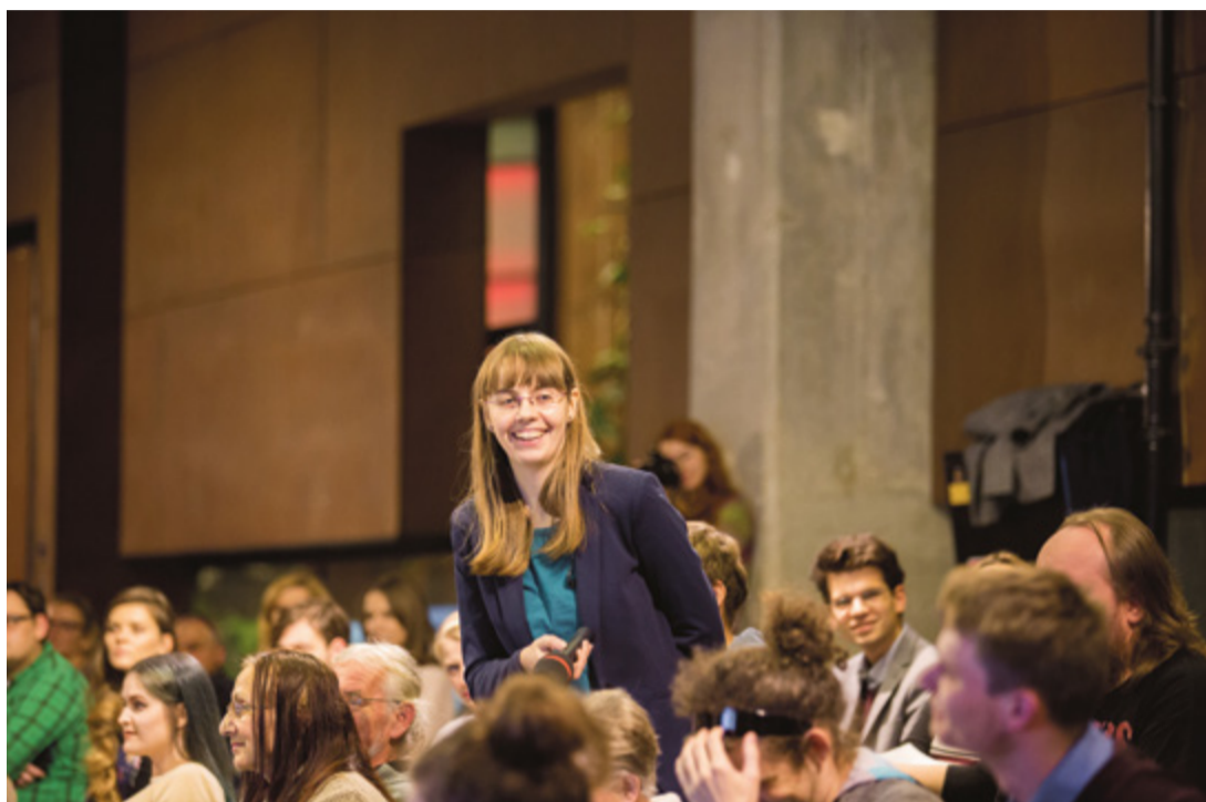
Toruńska debata już 12 grudnia, o godz. 18:00

Podczas debaty nie trzeba obawiać się sztywnej atmosfery ani zadawania pytań. Goście specjalni postarają się przybliżyć publiczności zawile filozoficzne problemy w prosty i jasny sposób zrozumiały dla każdego. Organizatorzy na facebookowej stronie wydarzenia piszą: „Zapraszamy serdecznie wszystkich miłośników filozofii, kultury, nauki i ludzi ciekawych świata z Torunia i okolic!”.