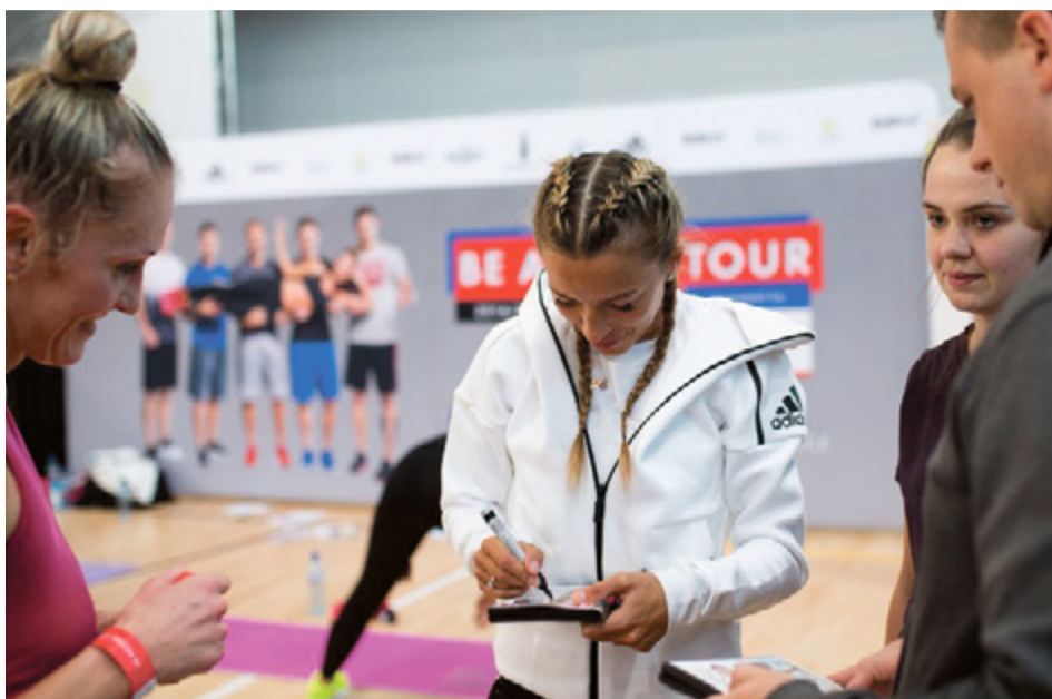
Ewa Chodakowska poprowadzi trening w sobotę 19 listopada

Ponad 100 osób weźmie udział w 5-godzinnym treningu, który poprowadzi z drużyną najpopularniejsza trenerka fitness w Polsce w ramach Be Active Tour. Wydarzenie odbędzie się w Toruniu w sobotę, 19 listopada, w Centrum Handlowym Toruń Plaza, przy ul. Broniewskiego 90. W ramach cyklu warsztatów, które odbędą się w 15 miastach Polski, Ewa Chodakowska zachęca do aktywności fizycznej i udowadnia, że ćwiczyć można zawsze i wszędzie, nawet w domu z butelką wody zamiast hantli!