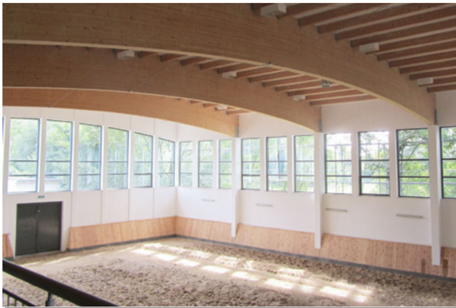
W poprzednich latach zrealizowano 84 projekty rewitalizacyjne

Wśród wskaźników decydujących o stopniu degradacji danego obszaru brano pod uwagę udział ludności w wieku poprodukcyjnym w ludności ogółem na danym obszarze, udział osób w gospodarstwach domowych korzystających ze środowisko