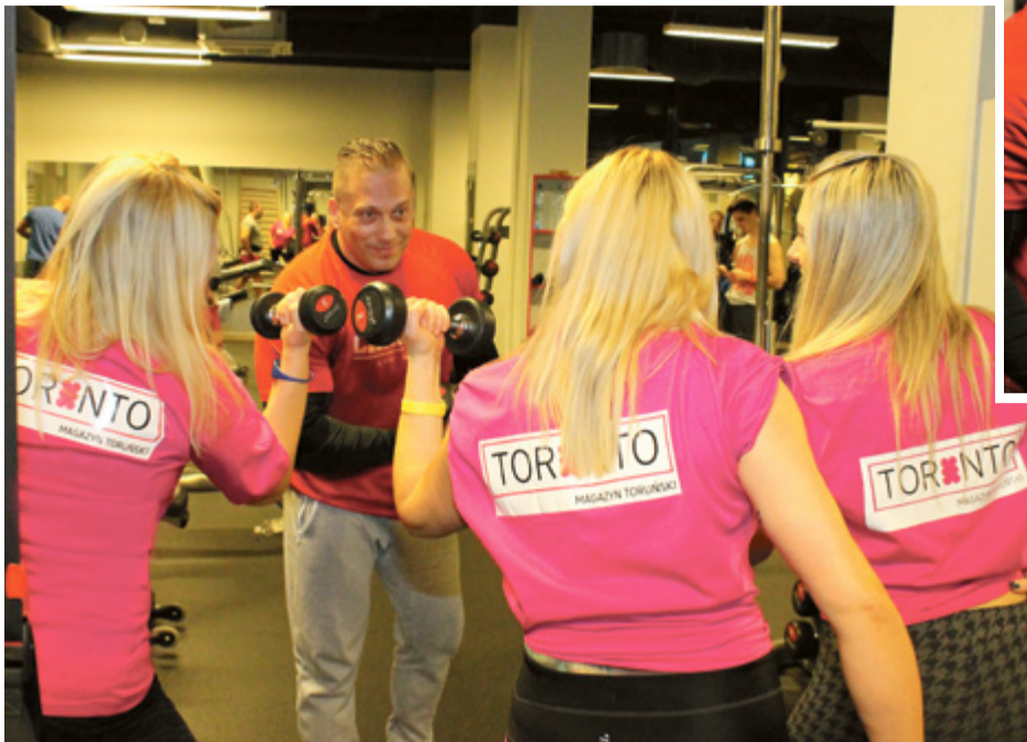
Panie z zespołu Toronto podczas ćwiczeń w Klubie Champion

Wszyscy, którzy chcą zadbać o sylwetkę i zdrowie zimą powinni przygotować sobie plan. Jeśli zła pogoda uniemożliwi aktywność na dworze, trzeba mieć w zanadrzu inną opcję, np. trening na siłowni. W toruńskim Champion Gym&Fitness czeka na nas trening dostosowany do indywidualnych potrzeb. Na zajęciach grupowych możemy ćwiczyć między innymi Zumbę, Tabatę, Fat Burning Dance, 6-pak, jogę, trx i zajęcia na trampolinach, a w strefie gym trening siłowy i funkcjonalny oraz cardio. W razie pytań dostępni są trenerzy personalni, którzy pomogą odpowiednio dobrać ćwiczenia i nauczą poprawnej techniki. Kiedy na dworze jest ciemno i zimno potrzebne są