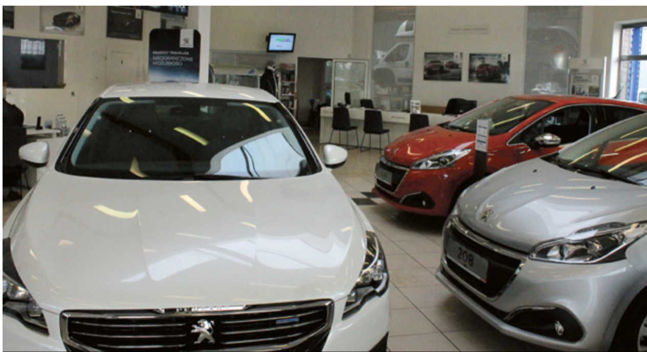
Okres jesienno-zimowy to dobry czas na zakup nowego samochodu