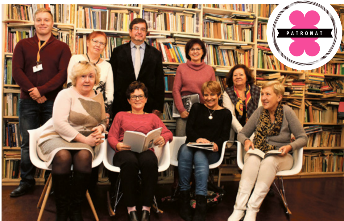
Wielki Test Języka Angielskiego odbędzie się 20 listopada w Auli UMK

języka angielskiego otwiera obecnie dostęp do wszelkiej potrzebnej wiedzy. Wielki Test Języka Angielskiego ma również na celu wyrównywanie szans. Dzięki tej społecznej inicjatywie istnieje coroczna możliwość bezpłatnego sprawdzenia swoich kompetencji językowych przez Polaków i tym samym kontrolowanie samorozwoju językowego – dodaje Akademia Nauki w Toruniu to