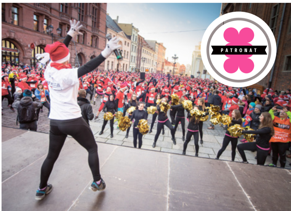
Półmaraton Świętych Mikołajów ściąga fanów aktywności i dobrej zabawy z całego kraju

Tegoroczna trasa będzie nietypowa. Po raz pierwszy uczestnicy zatoczą koło – pobiegą drogami i ścieżkami pieszo-rowerowymi lewo- i prawobrzeżną częścią Torunia. Pokonają dwa mosty: Elżbiety Zawadzkiej i Józefa Piłsudskiego. Pokonają trasą wiodącą przez Park Miejski na Bydgoskim Przedmieściu i Kampus Uniwersytecki, oczywiście będą mieli okazję podziwiać zabytki starówki. Finisz zawodów zaplanowano pod Areną Toruń na Bema. Na mecie wszyscy uczestnicy zostaną uhonorowani oryginalnym medalem, który zaprojektowali i wykonali toruńscy plastycy. Medal jest nietypowy, ponieważ został ubrany w mikołajową czapkę! W 2003 roku, kiedy po raz pierwszy zorganizowano Półmaraton Świętych Mikołajów, wystartowało w nim 166 biegaczy. Z