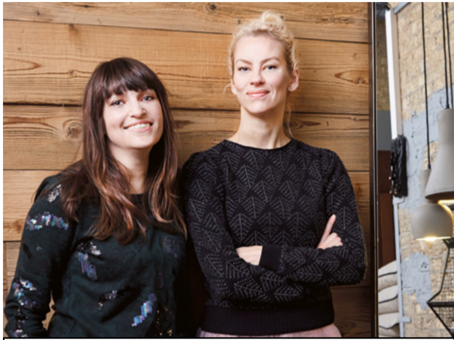
Projektantki z pracowni Atmosferic zalecają w małym mieszkaniu minimalizm