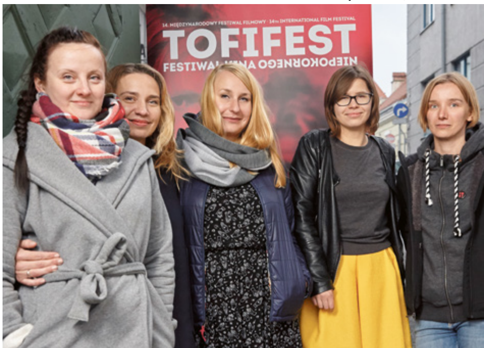
... z zespołem tworzącym „Toffest”