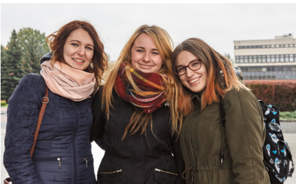
Studenci w naszym mieście znajdują dla siebie wiele promocyjnych ofert

W Toruniu jedno jest pewne – student swoje przywileje ma. Koniecznie sprawdźcie, co oferuje w tym roku starter studencki i gdzie czekają na was studenckie zniżki.