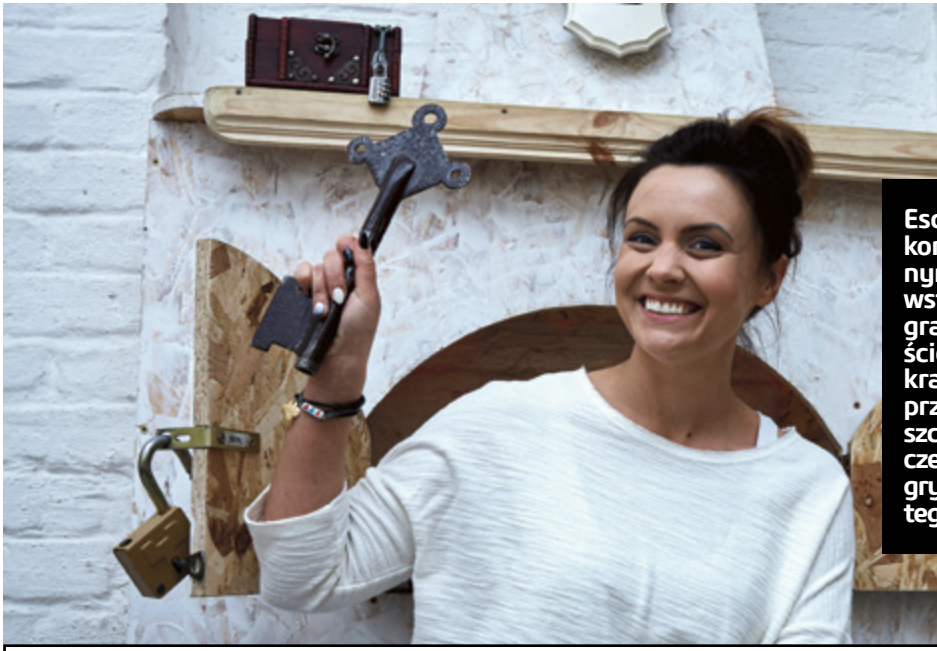
Najważniejsze to znaleźć wyjście z pokoju

Open The Door to jeden z pierwszych toruńskich escape roomów i do tej pory największy – dysponuje pięcioma pokojami. Można się tam zmierzyć ze swoimi największymi lękami w mroczących krew żyłach pokojach, jakimi są Nawiedzony Hotel czy pokój Kolekcjonera Twarzy. W bajkowy świat, pachnący goździkami i imbirem można przenieść się, będąc w Piernikowej Chacie, smak dalekich wypraw w nieznanie poznamy w Pokoju Podróźnika, a nieprzeniknioną głębię morskich fal – w Oceanie Strachu, który jest najnowszym pokojem Open The Door. Co jakiś czas zmienia się wystrój pomieszczeń – wówczas powstają nowe historie. Głównym