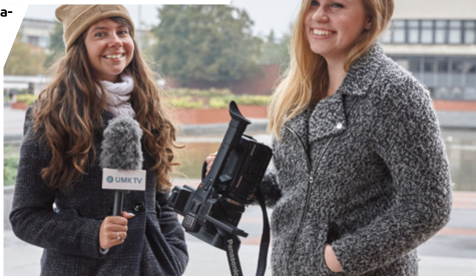
Gdzie skserować notatki? Gdzie się bawić? Jak dojechać na uczelnię? Sprawdziliśmy.

Wybór klubu na wieczorną imprezę zależy od indywidualnych preferencji. Osoby, które stawiają na kameralne grono powinny sprawdzić, takie miejsca jak: Cesky Sen, Kadr,