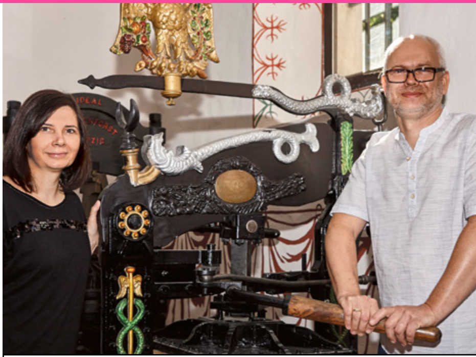
Muzeum Piśmiennictwa i Drukarstwa w Grębocinie

nice przedsiębiorstwa DAG. Ekspozycja jest interaktywna i multimedialna, a przewodnicy uzupełniają wystawę o historyczne ciekawostki. 2 kilometry trasy warto przejść w grupie i posłuchać opowieści muzealników, ale Exploseum można zwiedzać również bez wcześniej rezerwacji, indywidualnie. Muzeum znajduje się w sąsiedztwie Bydgoskiego Parku Przemysłowo – Technologicznego, zakładu Zachem i Puszczy Bydgoskiej, zwiedzać je można od wtorku do niedzieli od 9.00 do 17.00, w czwartki Exploseum czynne jest dwie godziny dłużej. Pierwsza z naszych propozycji spodoba się raczej starszym turystom, ale w regionie nie brakuje też atrakcji dla nieco młodszych zwiedzających. Muzeum Kolei Wąskotorowej w Wenecji koło Żnina to zdecydowanie propozycja na pogodny dzień spędzony w plenerze. To jeden z największych skansenów wagonów i lokomotyw taboru wąskotorowego w Europie. Część z eksponatów jest otwarta, z czego szczególnie młodzi turyści ochoczo korzystają, zaglądając do środka wagonów. Miłośnicy kolei mogą też sprawdzić jak wyglądała obrotnica kolejowa, budka dróżnika czy żuraw wodny dla parowozów. Popularność