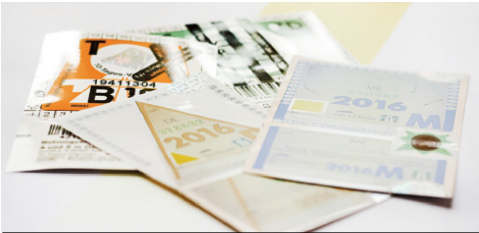
Papierową winietę należy nakleić w prawym, dolnym rogu przedniej szyby