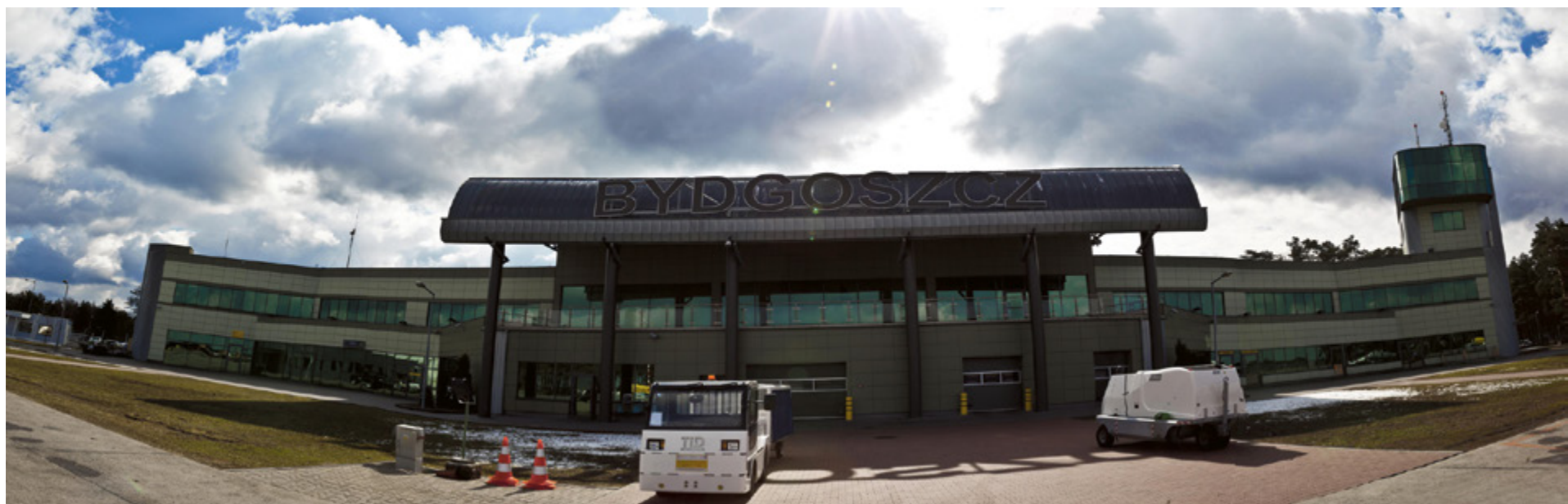
Na razie nazwa portu lotniczego w Bydgoszczy pozostanie bez wzbogacenia o „Toruń”

Port Lotniczy Bydgoszcz-Toruń miał być, ale się zbył. To znaczy lotnisko zostaje, ale bez „Torunia”. Nasze miasto kwotą 5 mln zł miało dokapitalizować spółkę, w zamian za dodanie grodu Kopernika do nazwy lotniska.