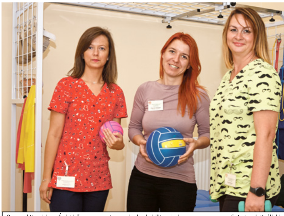
Personel Hospicjum „Światło” w wyremontowanej sali rehabilitacyjnej

W Czerniewicach fundusze zostały spożytkowane na prowadzenie Osiedlowego Ośrodka Integracji Dzieci, Młodzieży i Seniorów. Wycieczki, wyjścia do kina, teatru, spotkania z ciekawymi osobami, zajęcia ruchowe, kurs florystyczny i gotowania, pomoc dzieciom w nauce – to