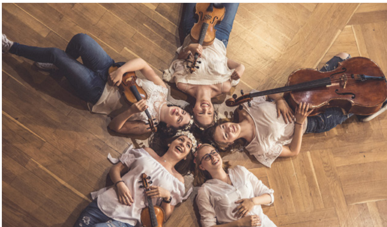
Dziewczyny z Infinito przygotowały ciekawe aranżacje znanych utworów