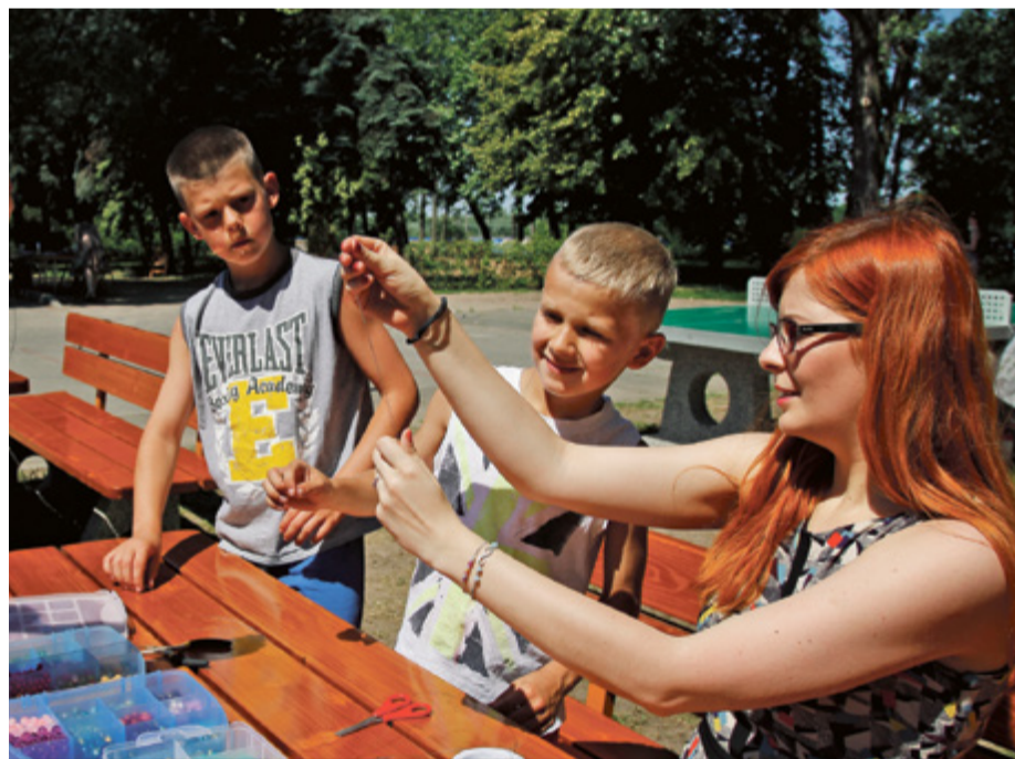
„Wędrująca ławeczka” to pomysł na międzypokoleniową integrację

Hanna Wojtkowska redakcja@toronto-magazyn.pl