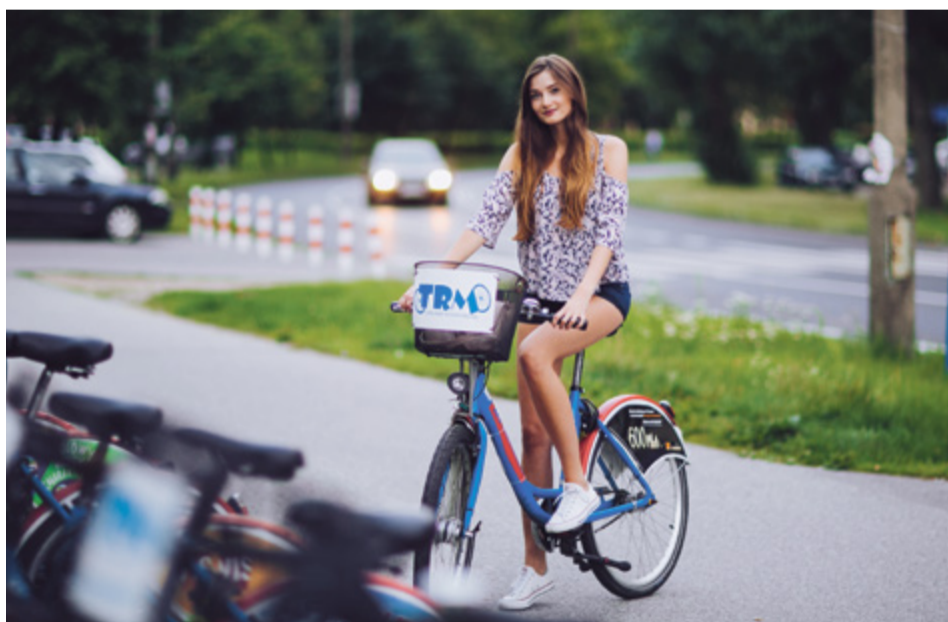
Wkrótce Toruniu pojawi się nowy model roweru miejskiego

Również jeszcze w tym roku pojawi się dodatkowych dziesięć stacji monitoringu jakości powietrza. – Kolejne stacje powstaną na wniosek mieszkańców i radnych. Do tej pory mieliśmy trzy takie punkty – na Kaszczorku, Starówce i na Rubinkowie. To państwowy monitoring, za który odpo-